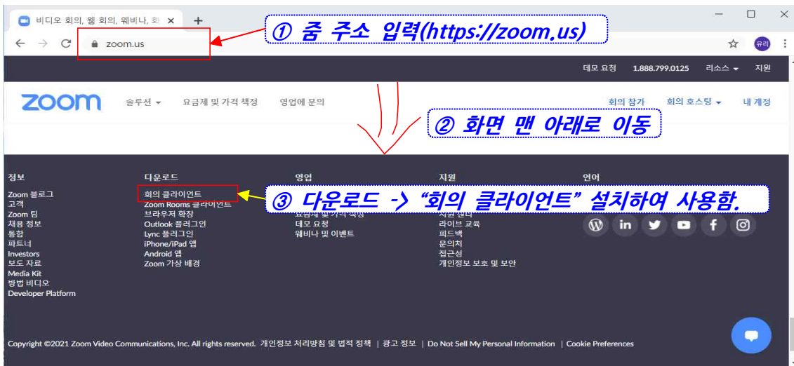
[컴퓨터에 Zoom 프로그램 설치 방법]